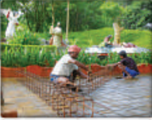
કાર્ય ચાલી રહ્યું છે

“હું ફરીથી તમને મળીશ ત્યારે તમે તમારાં મનમાં આનંદ પામશો.” (યોહાન ૧૬:૨૨)