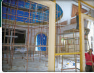
કાર્ય ચાલી રહ્યું છે