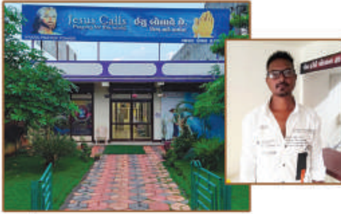
સરનામું : Jesus Calls Prayer Tower Unai Cross Road, Near Kapura Panchal Engineering Works, Old National Highway, No.6 AT/Post, Vyara Dist - Tapi, Gujarat - ૩૯૪૬૫૦ ફોન નંબર : +૯૧ ૯૩૮૦૭૫૨૨૨૫ / ૦૨૬૨૬ - ૨૨૧૨૩૪

મને છેલ્લા ૩ માસથી માથામાં સખત દુઃખાવો થઈ રહ્યો હતો. મેં બધા જ પ્રકારની સારવાર લીધી, રીપોર્ટ કરાવ્યા અને આખરે સી.ટી. સ્કેન કરાવ્યું પણ બધા જ રીપોર્ટ નોર્મલ આવ્યા હતા. તેથી મેં વ્યારામાં આવેલા જીસસ કોલ્સના પ્રાર્થના ભવનમાં ફોન કર્યો હતો. મેં મારી પ્રાર્થના વિનંતી આપી અને મારા માટે ફોન પર પ્રાર્થના કરાવવામાં આવી. પ્રભુની સ્તુતિ થાઓ. મને તે જ દિવસે સાજાપણું મળ્યું. હું પ્રભુનો ખૂબ જ આભાર માનું છું. મારા માટે પ્રાર્થના કરાવનાર પ્રાર્થના મધ્યસ્થનો હું આભાર માનું છું.