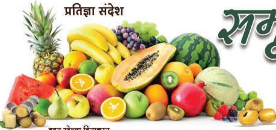
बहन स्टेला दिनाकरन